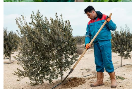
Red Globe LLC, Aserbaidshan 13